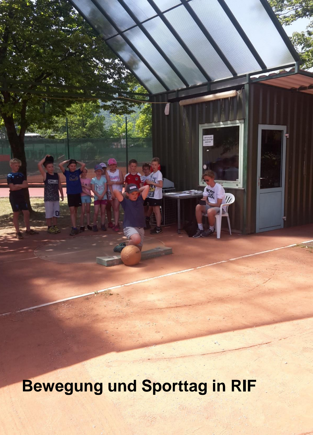
Bewegung und Sporttag in RIF