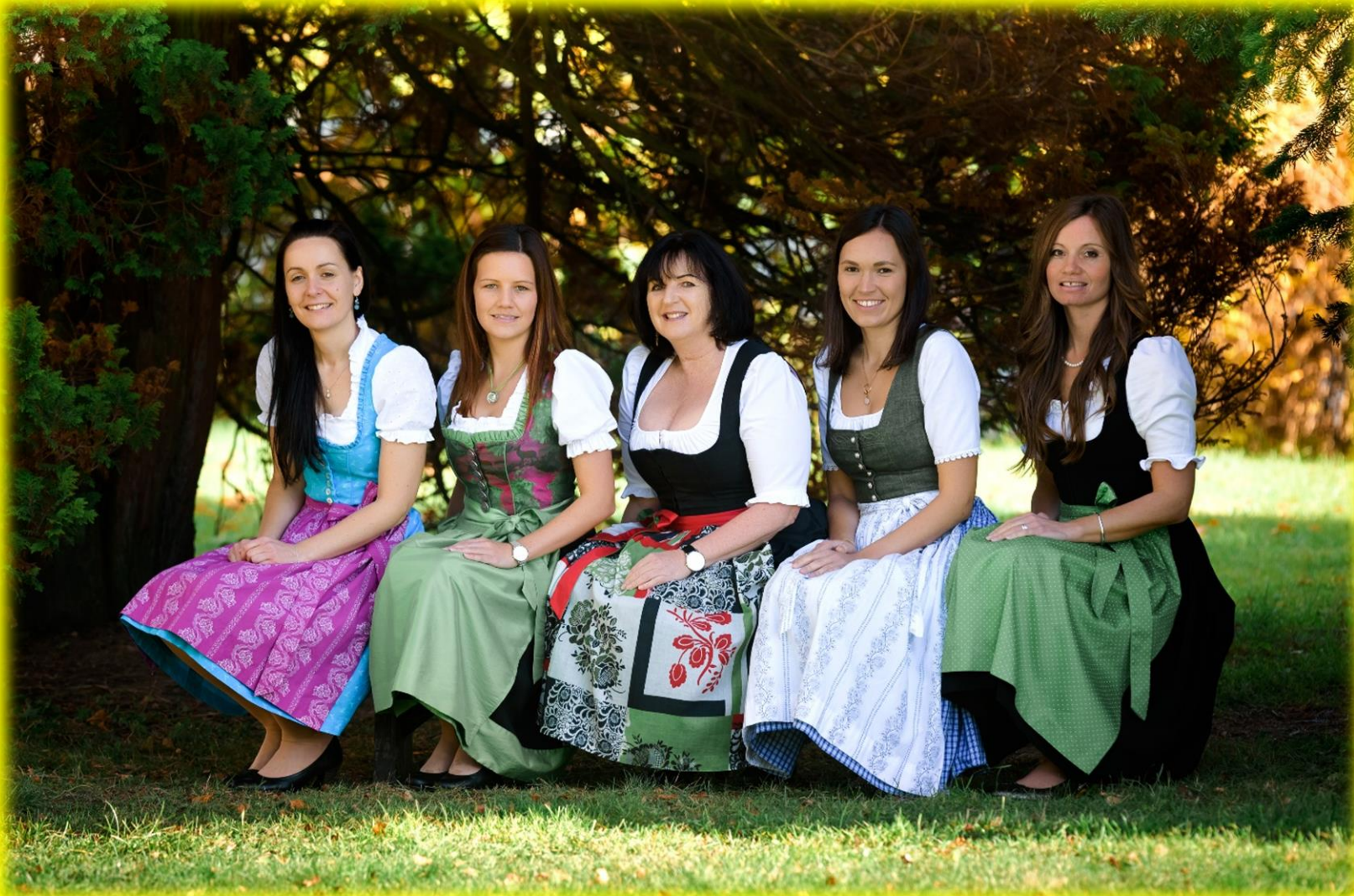
Das Team der VOLKSSCHULE FLACHAU